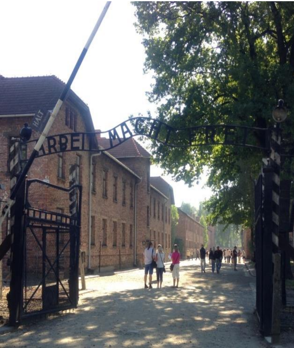
アウシュビッツ強制収容所