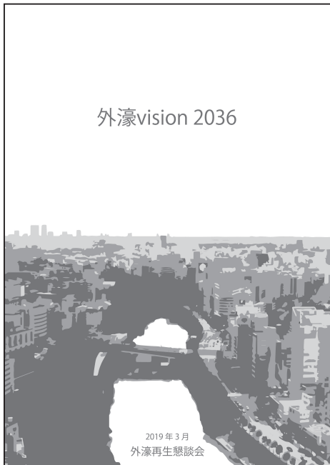
「外濠 vision 2036」の表紙イメージ

「外濠 Vision 2036」の内容は、外濠に関わる関係者の行動規範としての「外濠再生憲章」と、このように外濠を使いたい、というアイデアを絵柄にした「外濠四季絵巻」からなります。外濠四季絵巻は、これまで外濠市民塾におけるワークショップで地域の皆さんや大学生・高校生から出されたアイデアを、法政大学・東京理科大学・日本大学・中央大学の学生チームが協働して楽しい絵柄にまとめたものです。