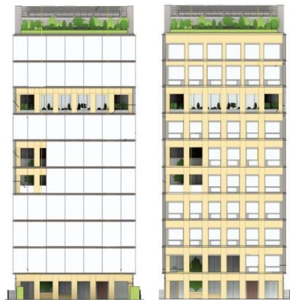
左：アウタースキン 右：インナースキン

冬季外皮熱性能の実測結果より、アウターガラスの効果も含めた窓全体の熱貫流率は1.71 W/(m 2 K)、木造の壁および柱は0.22 W/(m 2 K)と高い断熱性能を示していた。秋季において、ブラインドを全開にした状態での日射熱取得率は0.46、全閉にした状態では0.06となり、高い遮熱性能を確認できた。