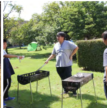
バーベキューグリル完備