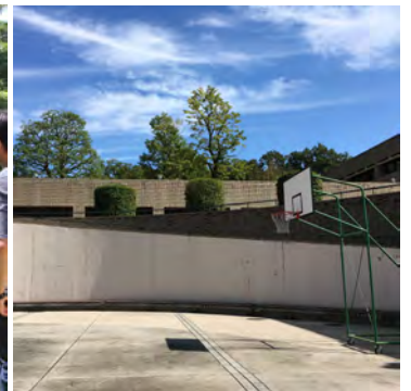
バスケットゴールも隣接

■日時 8月18日(金) 10時~20日(日) 15時 (途中入退場可能・荒天の場合中止)