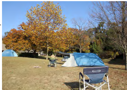
緩やかな傾斜のひだまり広場

ゴミとペットの糞は各自で持ち帰り 直火厳禁、アルコールは17時~21時 乳幼児家族とペット家族はゾーン区分