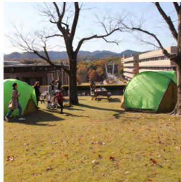
丹沢山系などの山並みを望める