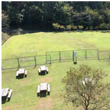
球技を楽しめる隣の芝生広場

キャンパス内の芝生広場にテントを張り、保全林の中をトレッキングしたり、 バーベキューサイトでの食事やキャンプファイヤーを囲んだり、 身近な大学キャンパスは思いのほかキャンピング向き。 キャンパス周辺やキャンパス内のガイドウォーク、 みんなで楽しむ軽スポーツやレクリエーション