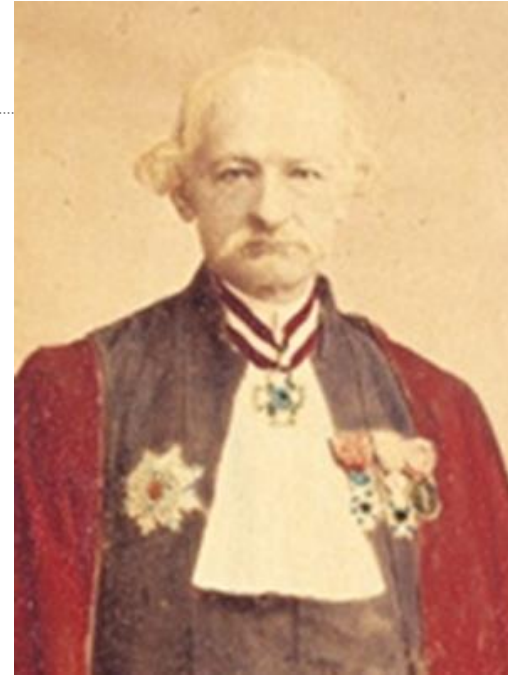
初代教頭 ボアソナード