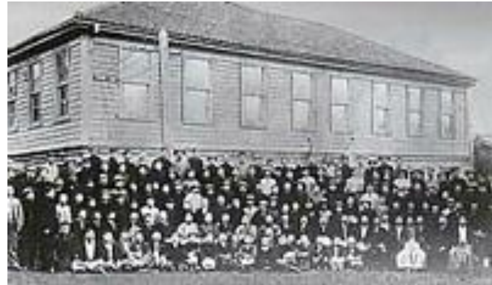
清国留学生法制速成科 卒業式記念写真（1906）