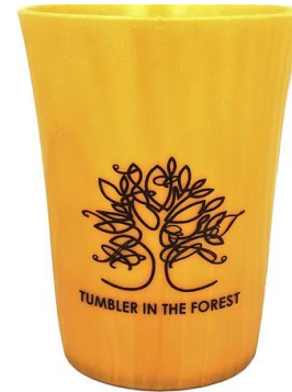
▲森のタンブラー アサヒユウアス株式会社が取り組む、植物原料を51%活用した”使い捨てしない“飲料容器

『「飲み物」から未来を変える』—そんな視点で、サステナブルな社会を創り上げていく方法をともに考えていく1日にしたいと思います。