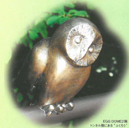
EGG DOME2階 トンネル側にある“ふくろう”