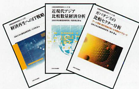
比較経済研究所シリーズ

The institute publishes the following publications. The Institute of Comparative Economic Studies Research series can be purchased at bookstores. Please contact the ICES if you wish to obtain further information.