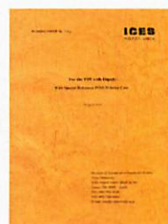
ワーキングペーパー シリーズ

Journal of International Economic Studies (in English)