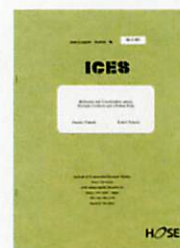
ディスカッションペーパー シリーズ