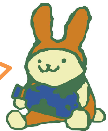
法政大学キャラクター えこぴよん