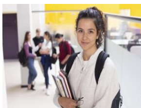
学生生活の様子を国内外に発信 私の好きな授業

学生生活の様子をVlog（ビデオログ）動画で紹介するページです。SNSとリンクします。