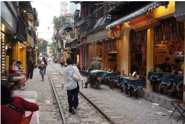
▲線路カフェに行った時の写真です。結局列車は見られませんでした・・・。