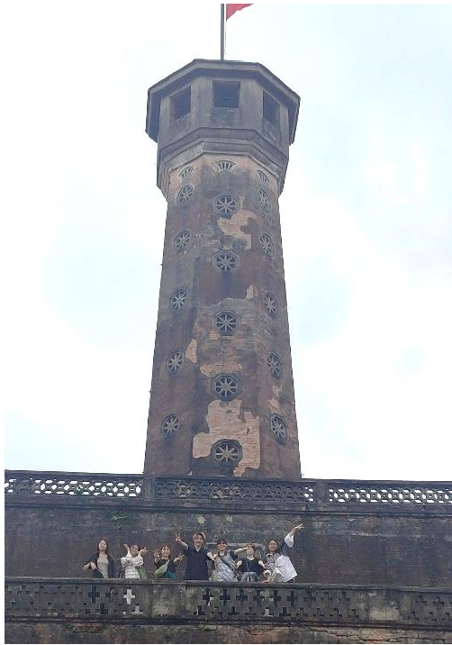
▲ハノイ旗塔にみんなで登った時のものです。