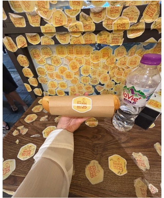
▲ULIS の学生とバインミーを食べた時の写真です。 このバインミー屋さんにはステッカーをお店に貼る文化があり、実際に私もメッセージを記入して貼りました！！