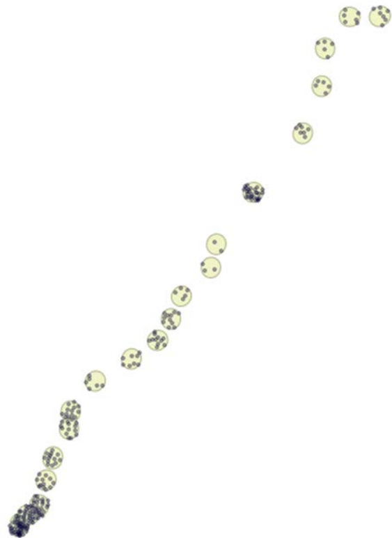
図1 駅からのバッファ圏域と選択地物

図1は、沿線の各駅から発生させたバッファ圏域とそれによって選択された地物(町丁字の重心点)を掲げたものである。この図にも示されているように、沿線の 20 駅の中には、隣駅との距離が近くお互いのバッファ圏域が重なるケースもある。このような駅については、双方で重複選択され