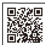
インターンシップ 振り返りシート