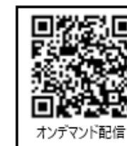
オンデマンド配信

※予約開始時期は別途メールにて連絡します。 ※第1回（7月開催）第2回（9月開催）のオンデマンド配信もぜひご覧ください！