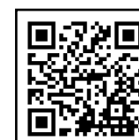
業界・企業 研究シート