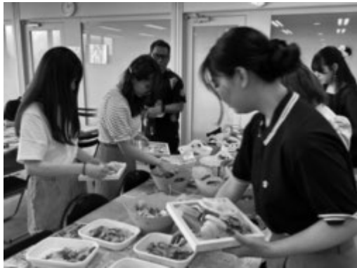
海岸で拾ったゴミでアート作品を体験