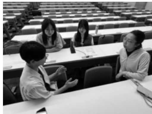
グループディスカッションをする様子