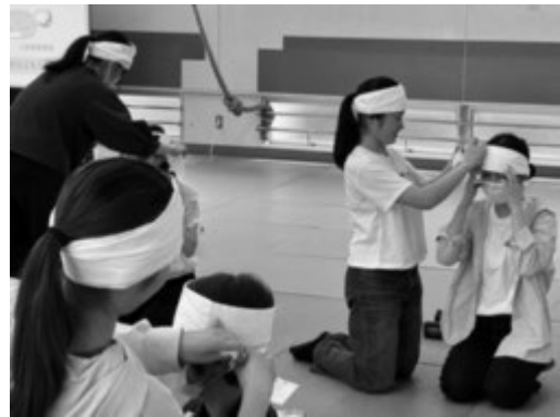
応急手当活動について学ぶ