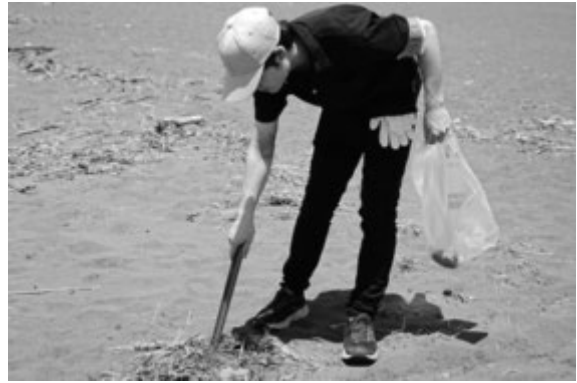
海岸でゴミを拾う学生