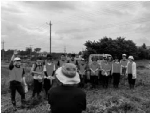
農家さんと交流をする学生