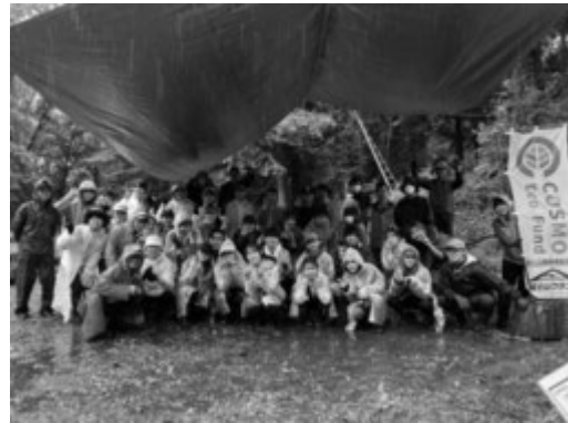
活動後の集合写真