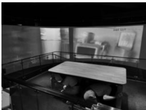
池袋防災館で災害の模擬体験を行う