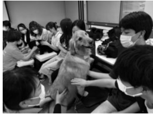
セラピー犬が順番にまわり学生と触れ合う様子