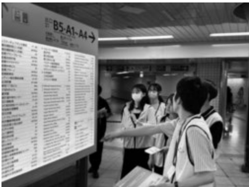
案内板を確認する学生