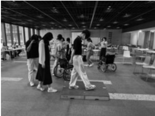
視覚障がいの方の見え方を歩いて体験する学生