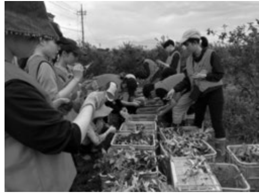
ブルーベリーの葉の摘み取り作業をする様子