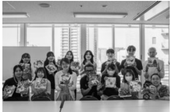
完成した作品を手に集合写真