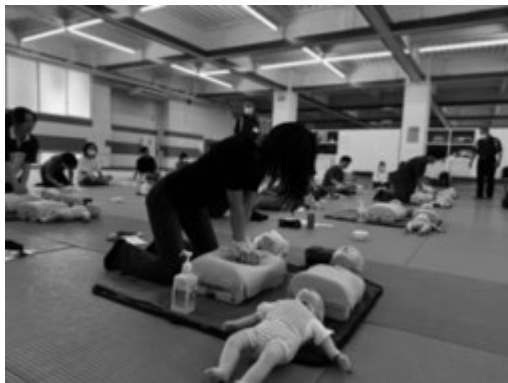
2 日目に開催された AED を実際に体験する学生