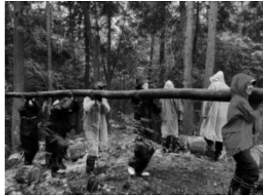
大自然の中、原木を運ぶ学生