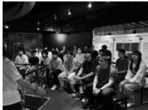
3 日目、池袋防災館で職員から説明を聞く