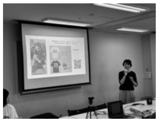
アクセプションズ様の講義

6 参加学生の感想 自分が今まで既存の社会の枠組みのようなものに縛られて、ダウン症の方々も含め様々な物事人と向き合っていたのだなということを痛感しました。傷ついたということではなくて、むしろすごく今日の講義を受けて、自分も含めて色々な人の持つ個性を受け入れてもらえたような気がして幸せな気持ちになりました。今回はこのような機会を作っていただき、ありがとうございました。