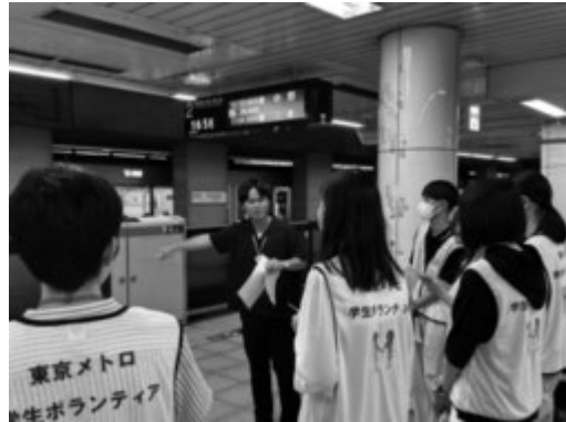
駅ホームについて学ぶ学生