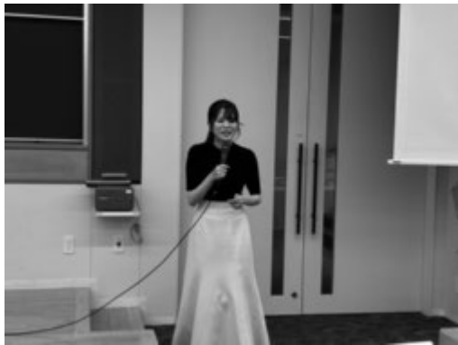
司会をする学生スタッフ