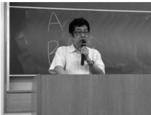
震災についてご講義される教授