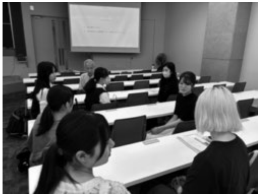
グループディスカッションをする参加者