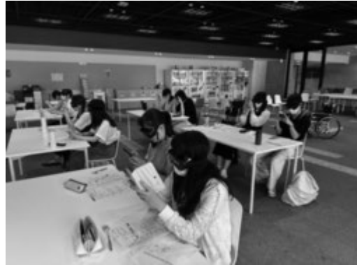
視覚障がいの方の見え方をスマートフォンを見て体験する学生