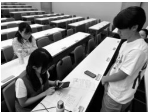
災害伝言ダイヤルアプリを実際に体験する参加者