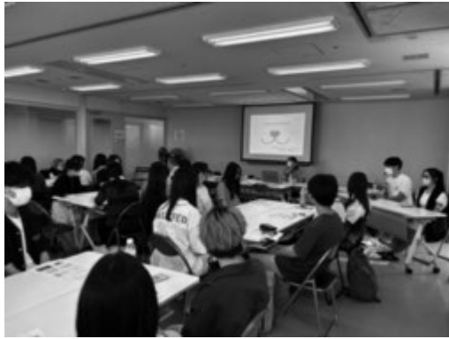
司会をする企画学生