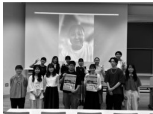
参加者全員で集合写真