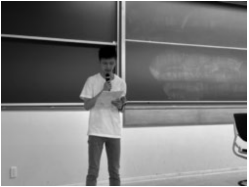
司会をする VSP 企画者