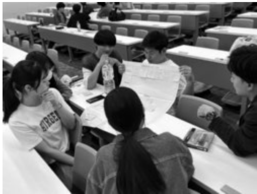
災害ボランティア活動のケースワークの様子