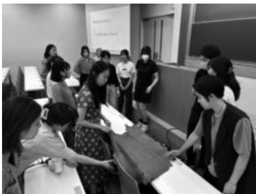
鹿の皮を触る体験