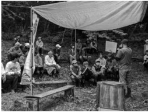
富士山クラブの方からの説明