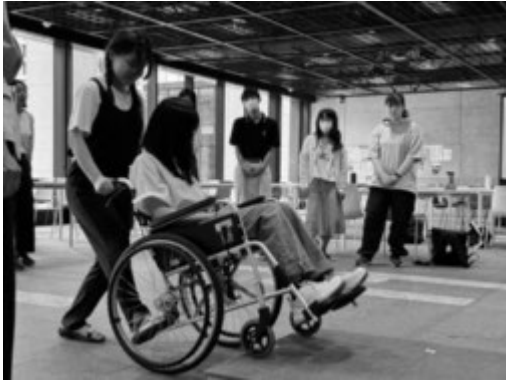
車いすの取り扱い方法を学ぶ学生