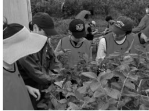
ブルーベリーの収穫体験の様子