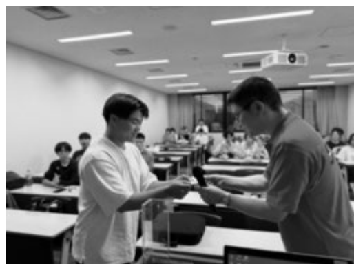
認定書を受け取る学生