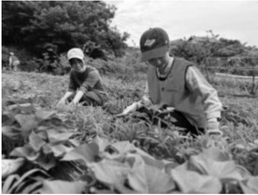
畑の雑草除去作業の様子