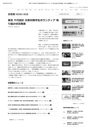
※③ 東京 千代田区 災害対策学生ボランティア 取り組み状況 発表 | NHK 首都圏のニュース