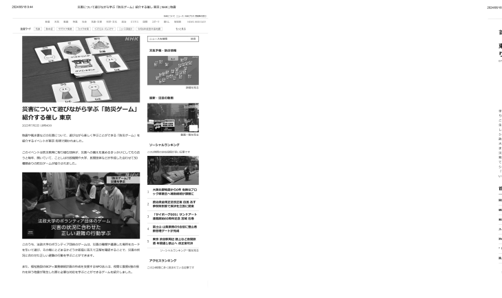
※② 災害について遊びながら学ぶ「防災ゲーム」紹介する 催し 東京