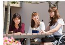
▶ 春学期派遣留学制度・募集要項