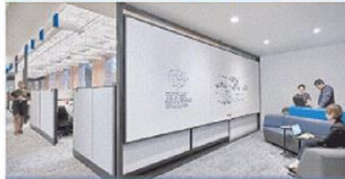
豊田工業大学シカゴ校