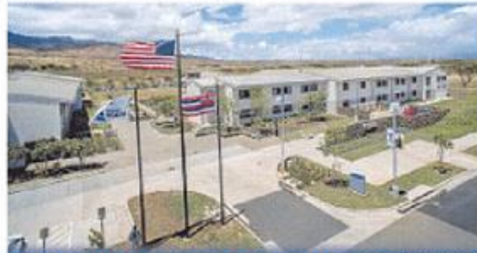
東海大のハワイにあるキャンパス