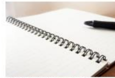
▶ 派遣/認定海外留学生 就職活動・進学準備アンケート