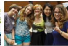
▶ 秋学期派遣留学制度（追加募集）・募集要項