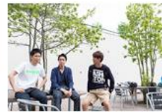
▶ 秋学期派遣留学制度・募集要項