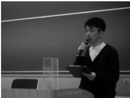
総括を述べる学生