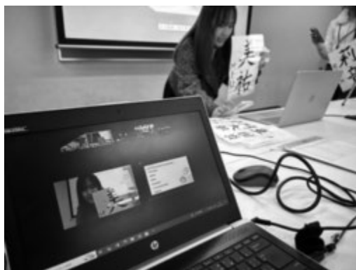
自己紹介をしながら最初の挨拶をする企画者