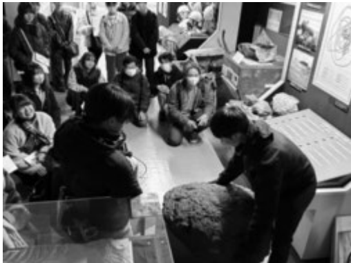
阿蘇火山博物館での様子