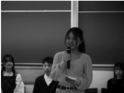
研修会について発表する学生