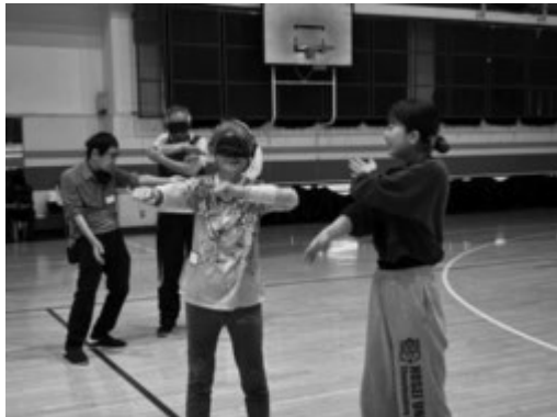
最初の準備体操の様子