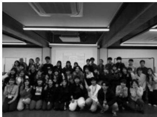
熊本大学工学部公認サークル「熊助組」の皆様と記念撮影