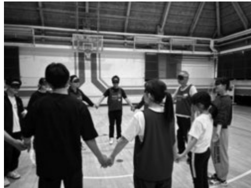
アイマスクをし声を掛け合う