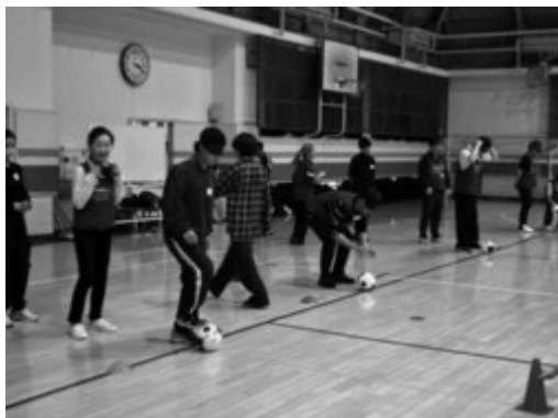
声を頼りにボールを蹴る