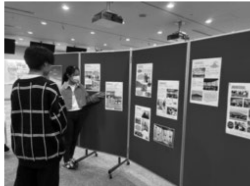
活動報告をする学生