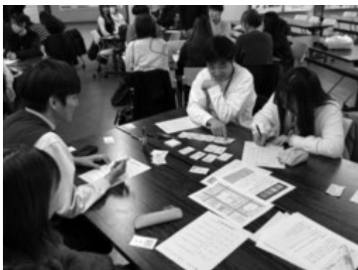
熊助組と交流する学生スタッフ