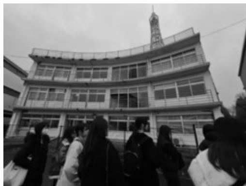
被災した旧東海大学阿蘇校舎 1号館建物を見学する学生