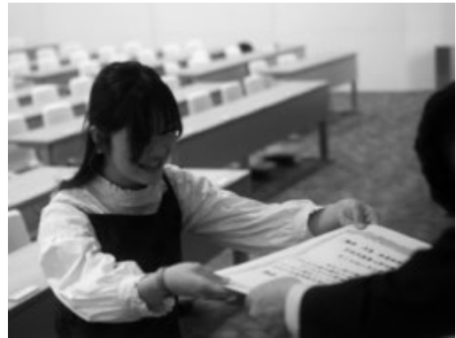
感謝状を授与される学生