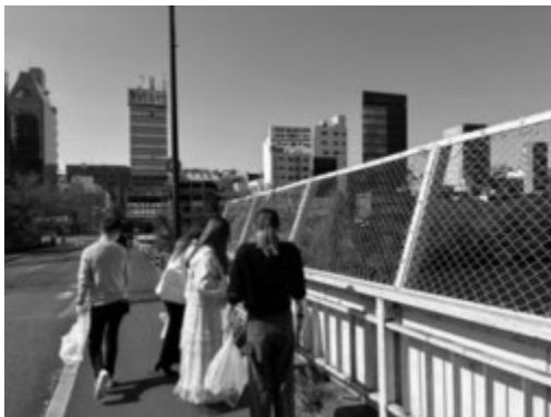
キャンパス周辺のごみを拾う参加者

<お問い合わせ先> 市ヶ谷ボランティアセンター (外濠校舎1階学生センター内) TEL:03-3264-9516 Mail:ichigayavc-apply@ml.hosei.ac.jp