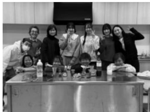
みんなの世界テーブルの皆さんと VSP 企画者の皆さん