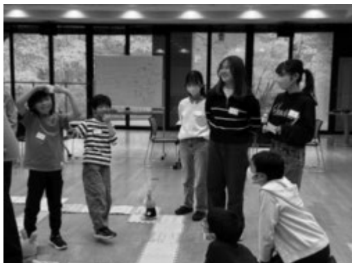
ゲームを通して子どもたちとの交流を楽しむ様子