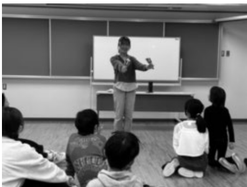
伝統的な「よさこい」を披露する様子