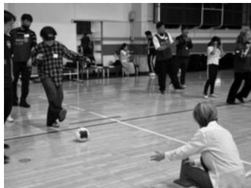
アイマスクをしながらボールを蹴る体験をする参加者