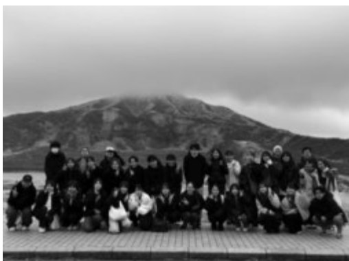
阿蘇山の前で記念撮影