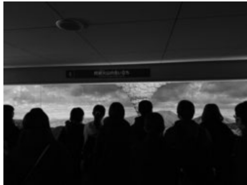
阿蘇火山の生い立ちについて学ぶ学生