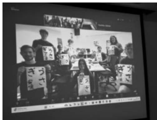
企画終了後の集合写真