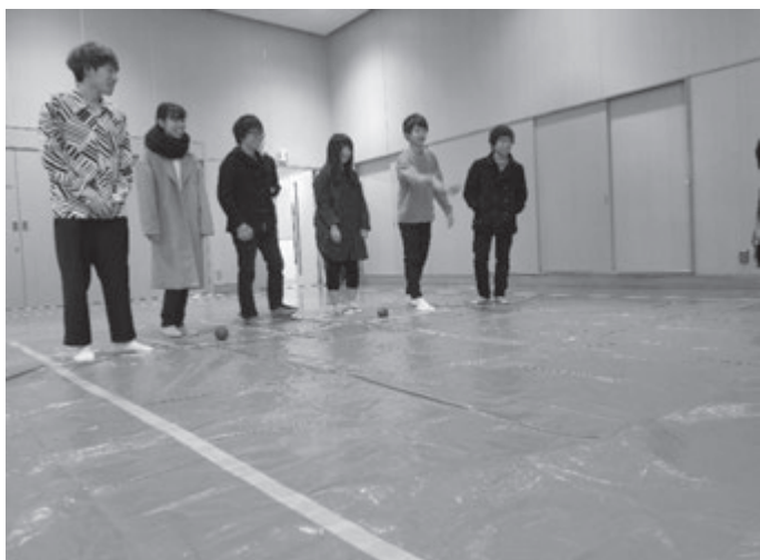
後攻チームの投球