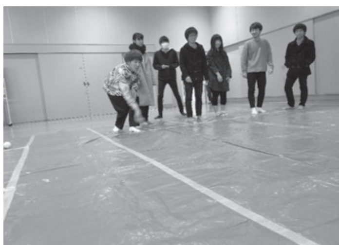
後攻チームの最終投球