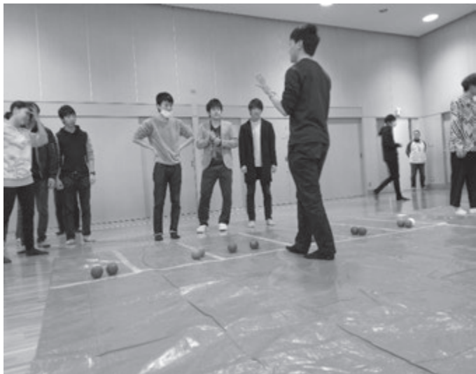
ボッチャ・トーナメント戦 開始！