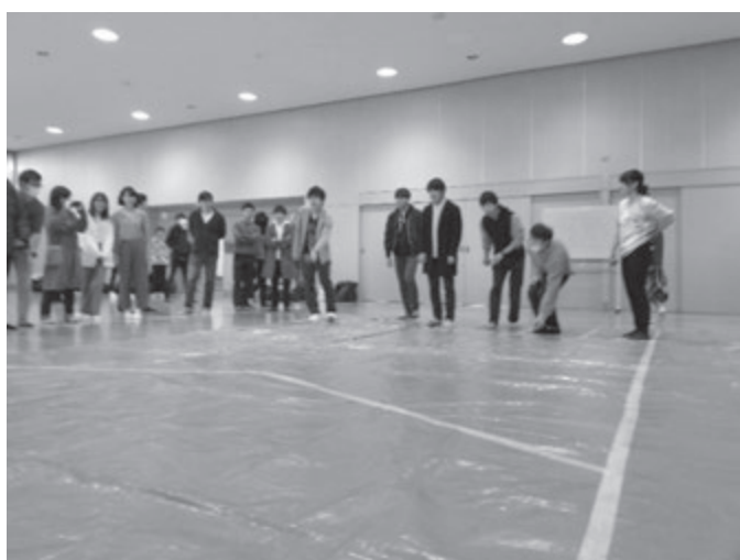
そして、熱戦が繰り返される！