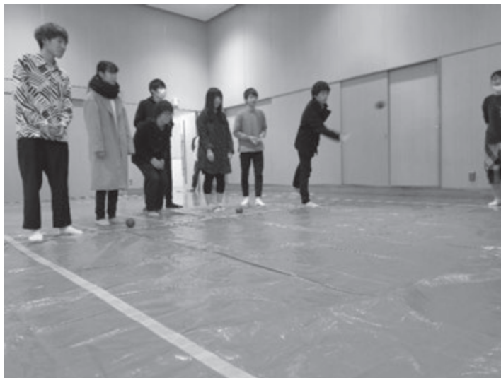
先行チームが初球を投球