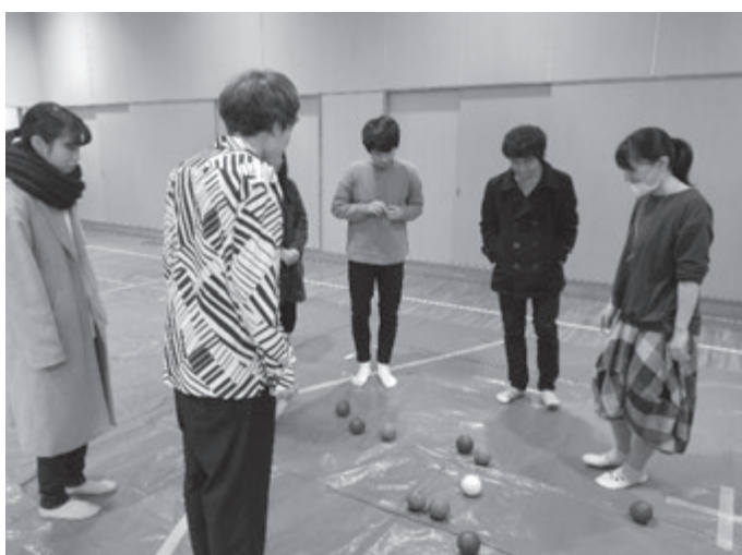
審判が判定、勝敗の行方は！？