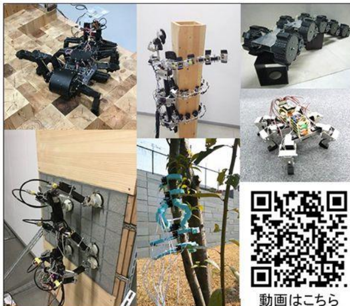
知能ロボット研究室で開発したロボット