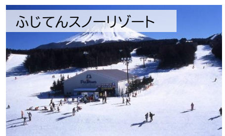
ふじてんスノーリゾート