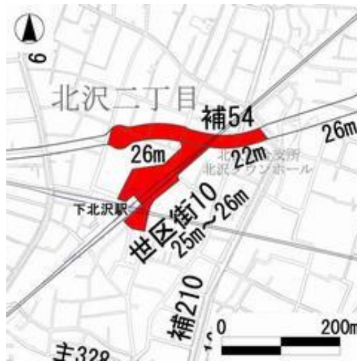
図1:補助54号線、世区街10号線の事業区域図 23