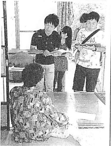
民家でシカなどによる農業被害について話を聞く法政大の学生たち