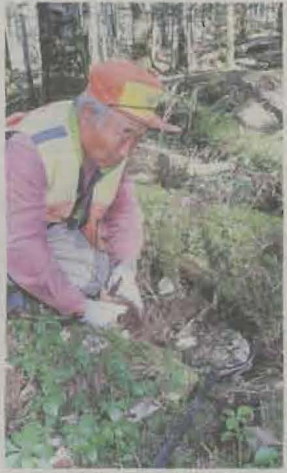
南アルプスの亜高山帯にくくりわなを仕掛ける猟友会員。昨年11月

南アルプスで深刻化するニホンシカの高山植物の食害や踏み荒らしをめぐり、南ア食害対策協議会（事務局・伊那市）は17日、本年度の活動報告会を伊那市役所で開く。新たに始めた「くくりわな」による捕殺の現状や課題などを