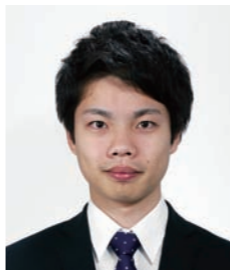
修士課程 2016年度修士