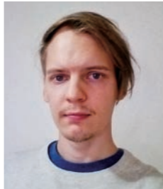
博士後期課程 在学中