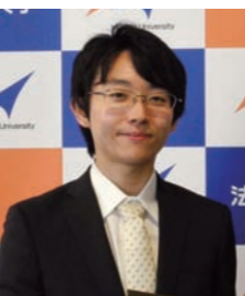
修士課程 2014年度修了 株式会社アトラス