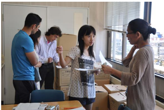
昨年度の第2回プレ研修の様様

連絡先：法政大学国際文化学部事務(03-3264-9345, *参加無料、事前申込み不要)