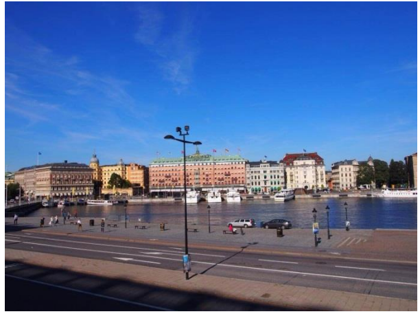
スウェーデンの街並み