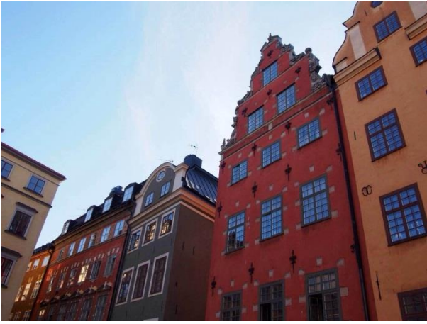
スウェーデンの街並み