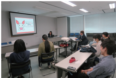
大学にて講師による講義

このプログラムを経て、献血について正しい知識と経験を得ることができたようです。参加者には再度献血に参加してもらい、さらに周囲の方へも広めてもらいたいです。