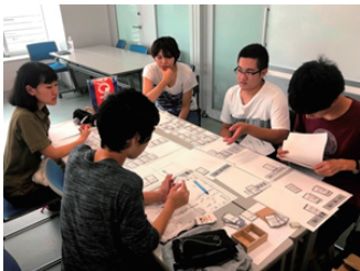
避難所運営ゲームで避難者の配置を検討

全ての企画において、座学形式ではなく体験型のプログラムであったため、積極的に学ぶことができ、避難所運営の難しさや、避難所運営のノウハウを身につけることができたようです。