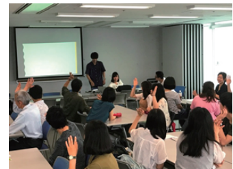
防災クイズで回答する学生たち