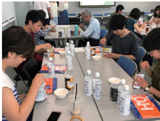
アルファ米や缶入りパンなどの非常食を試食