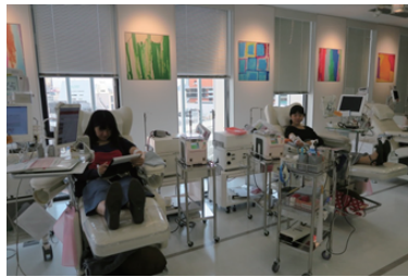
新宿の献血ルームにて実際に献血