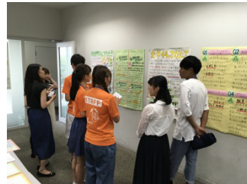
法政大学の魅力を伝えるために、準備に余念がありません