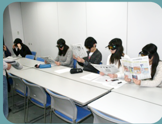
新聞の文字もなかなか読めません