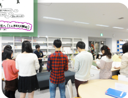
まずはキャリアセンターの利用方法について説明します