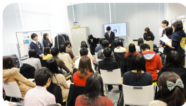
後輩の前でお手本を示します