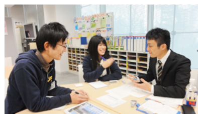
親身になって就活生の疑問にお応えします

これから就職活動を迎えるにあたり、漠然とした不安を抱えている就活生の疑問を解消するために企画されました。