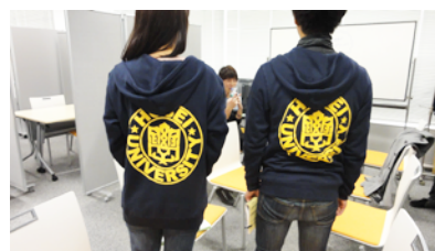
お揃いのジャンパーを着て活動します