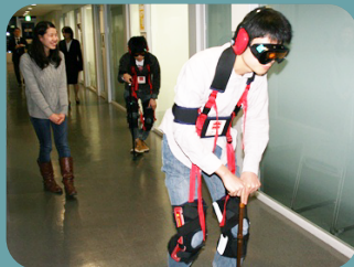
シニアボーズをつけて、学内へ