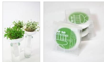
企画商品化第二弾「PIT.POT」 (2012年9月～発売)