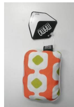
「MAMO」折りたたみ収納時