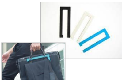
企画商品化第一弾「ポータブルスーツハンガー」 (2011年11月～発売)