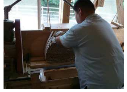
⑫ 磨いて表面をなめらかにする