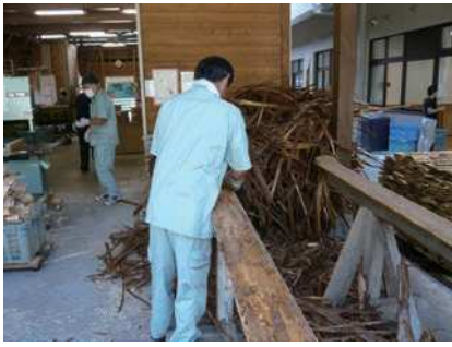
① 背板（端材）の樹皮をむく