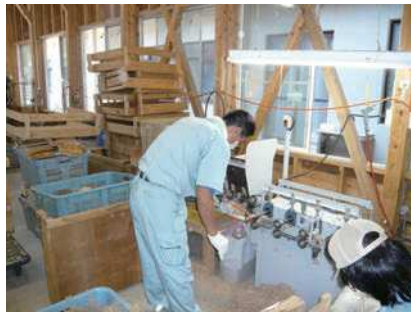
⑪ 面取り（四隅と中溝の面を取る）