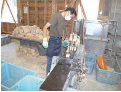
④ 板面をカンナがけする