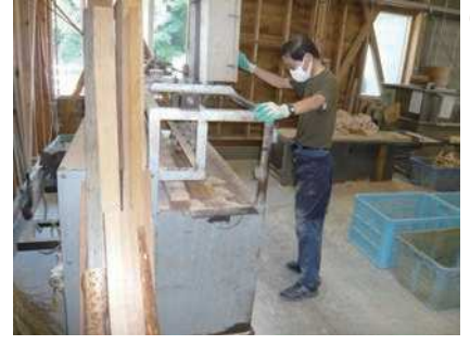
③ 製材2 箸の長さに切りそろえる