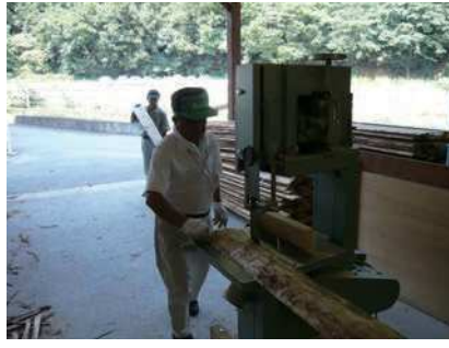
② 製材1 背板を15cm幅に切る