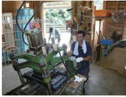
⑧ 箸の形にプレス裁断