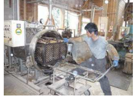
⑥ 高圧釜に入れて蒸す