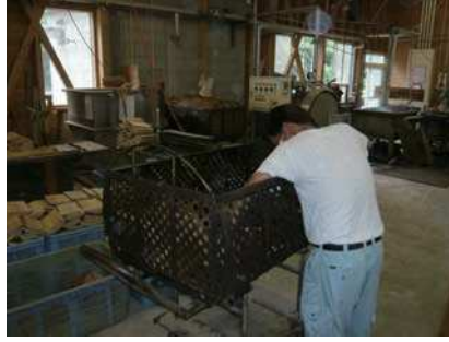
⑤ 背板をカゴに詰める