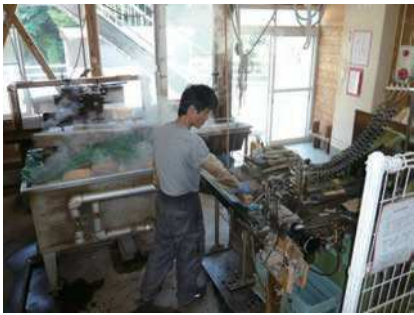
⑦ 箸の厚さにスライス裁断