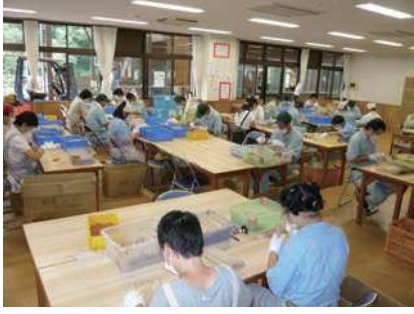
⑩ 選別（不良品を取り除く）