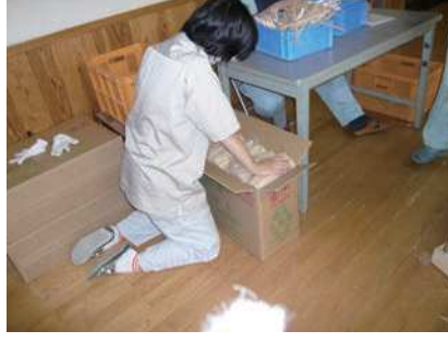
⑭ 箸の束を箱詰めする