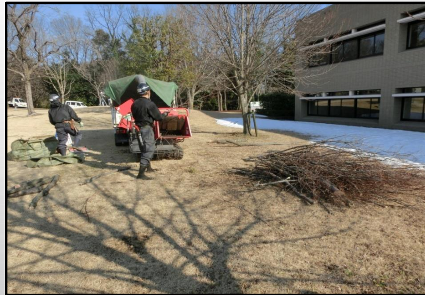
剪定した枝はパワーカッターという専用の機械を使いウッドチップを作ります