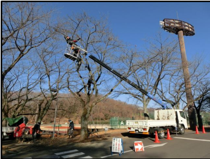
落葉樹剪定作業の様子