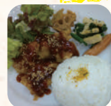
ヤンニョムチキン