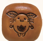
プレミアムあんぱん