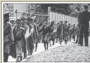
「野外演習に出発」