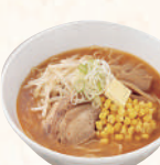
味噌バターコーンラーメン