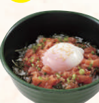
とろ玉サーモン丼