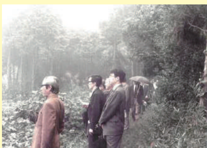
1971年 社会学部棟付近 用地視察