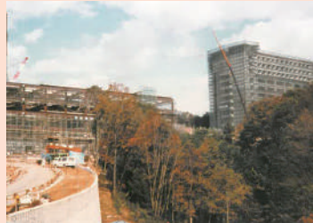
EGG DOME 付近からみた図書館(左)・総合棟(右)

神奈中バスを利用している学生さんはびっくり!かと思いますが、開設前の法政通りは車1台がやっと通れるほど、こんなにも狭かったんです。