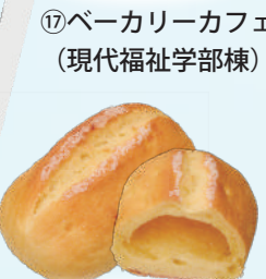
はちみつバターパン