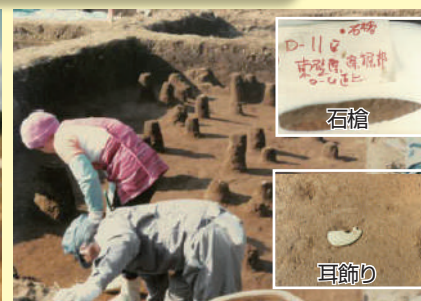
1981年 多摩キャンパス内 風間遺跡

1964年に町田校地(現多摩キャンパス)を約半分、1967年に現在の多摩キャンパスをほぼ購入。 山を切り拓いたキャンパスでしたので、校舎が建設されるまでは歩くのもやっと……。 さらに、工事の途中で縄文時代の遺跡も発見されていました!