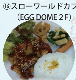
ヤンニョムチキン