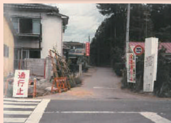
町田街道から見た法政通り