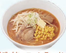
味噌バターコーンラーメン