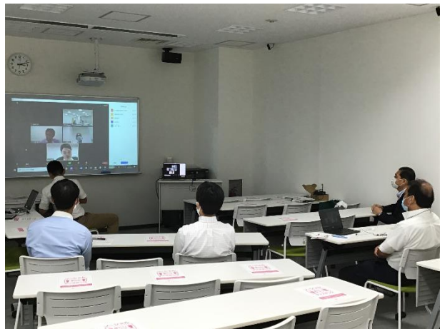
第3部（ディスカッション）の様子