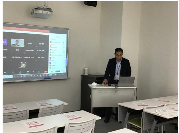
第2部（事例紹介）の様子①